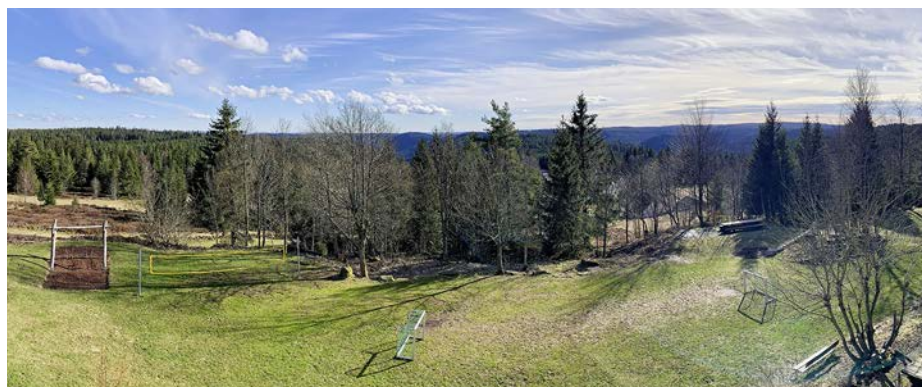
☒ Naturfreundehaus Kniebis (M 54): reizvolle Aussichten und schöne Wanderwege.