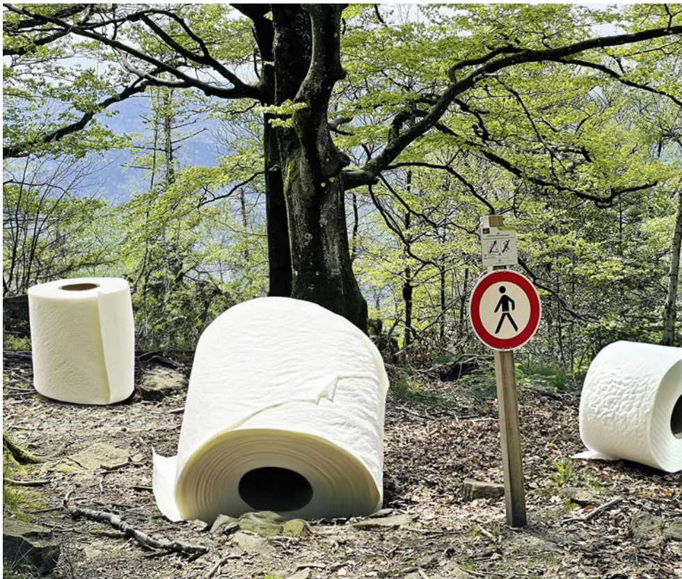
☒ Das KI-generierte Foto übertreibt vielleicht. Trotzdem: Müll in der Natur nervt!

BESTSELLERAUTORIN „MEINE SCHNITZWERKSTATT“