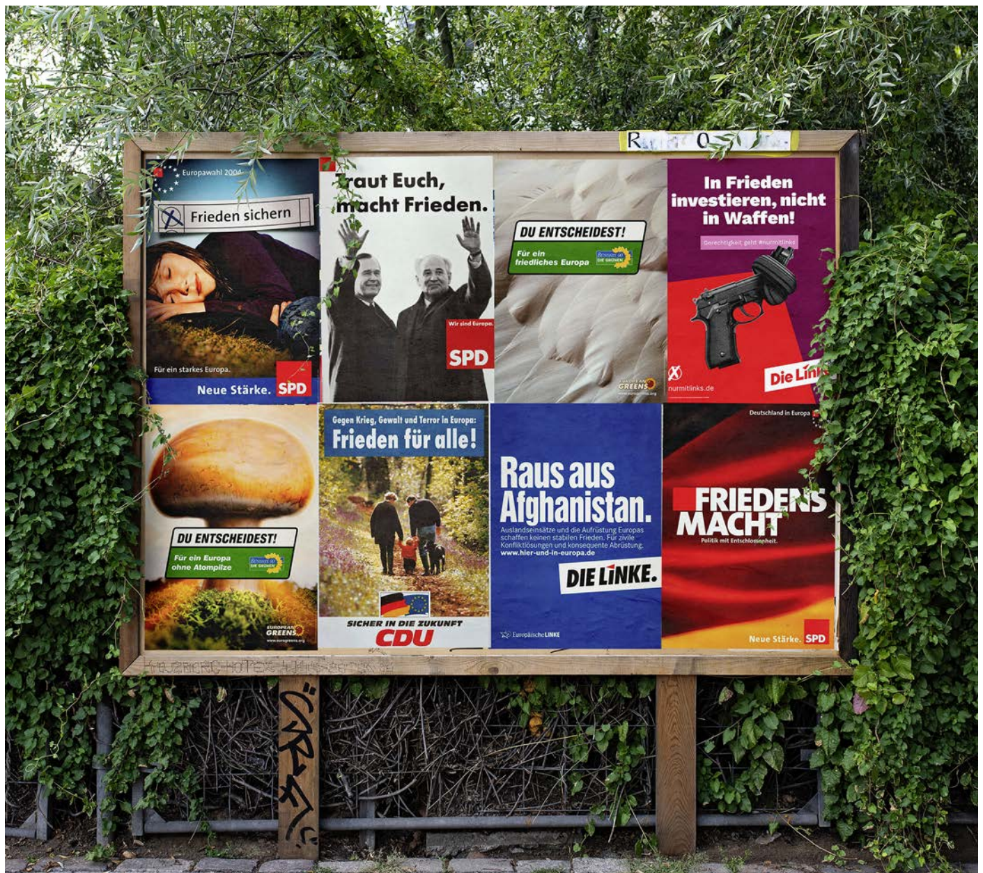
Um Frieden ging es in früheren Europawahlkämpfen häufig. Die CDU versprach 1984 „Frieden für alle!“. Bei der SPD sicherte ihn 2004 noch eine Schlafende. Die Grünen waren 2004 „Für ein Europa ohne Atompilze“. Die Linken-Forderung von 2009 „Raus aus Afghanistan.“ ist erfüllt.

Staats- und Regierungschefs. Vor allem darf das Parlament selbst keine Gesetzesvorschläge erarbeiten. Dafür ist die Kommission zuständig. Das Parlament kann diese nur um Ausarbeitung eines Vorschlags bitten. Den Bitten muss die Kommission nicht folgen und tut dies überwiegend auch nicht.