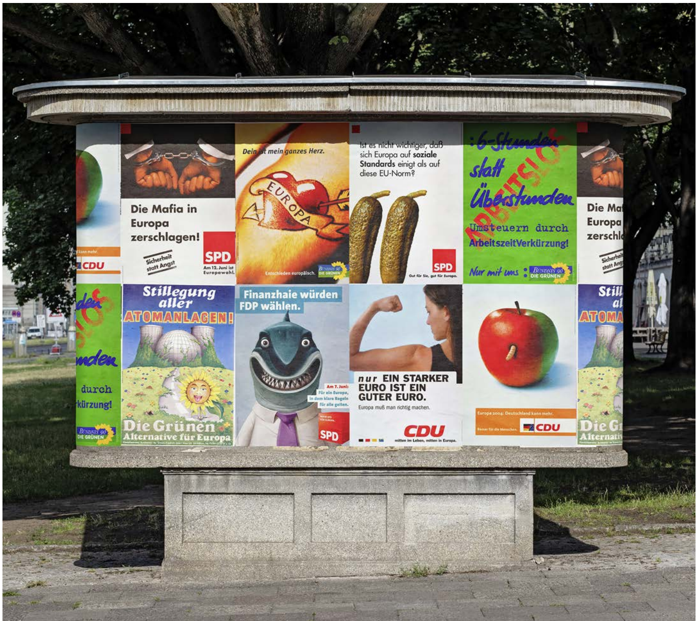
☒ Auch Mängel der EU waren Wahlkampfthemen: Die entstehenden Grünen waren schon 1979 gegen „alle Atomanlagen“. 1999 verarbeitete die SPD eine angebliche EU-Gurken-Norm und die CDU warb per Bizeps für den „guten Euro“. Laut SPD wählten 2009 Finanzhaie noch die FDP.

die Ausnahme. Das Europaparlament kann aber Handelsverträge der EU mitbestimmen und hat dabei auch ökologische und soziale Standards eingebracht. Es hat maßgeblich das EU-Lieferketten-gesetz mitgestaltet, nach dem Unternehmen bei Lieferanten auf die Einhaltung von Umweltstandards und Respektierung der Menschenrechte achten müssen. Auch in der Entwicklungspolitik, etwa bei der Neugestaltung der Beziehungen zu Afrika, hat sich das Parlament sehr engagiert.