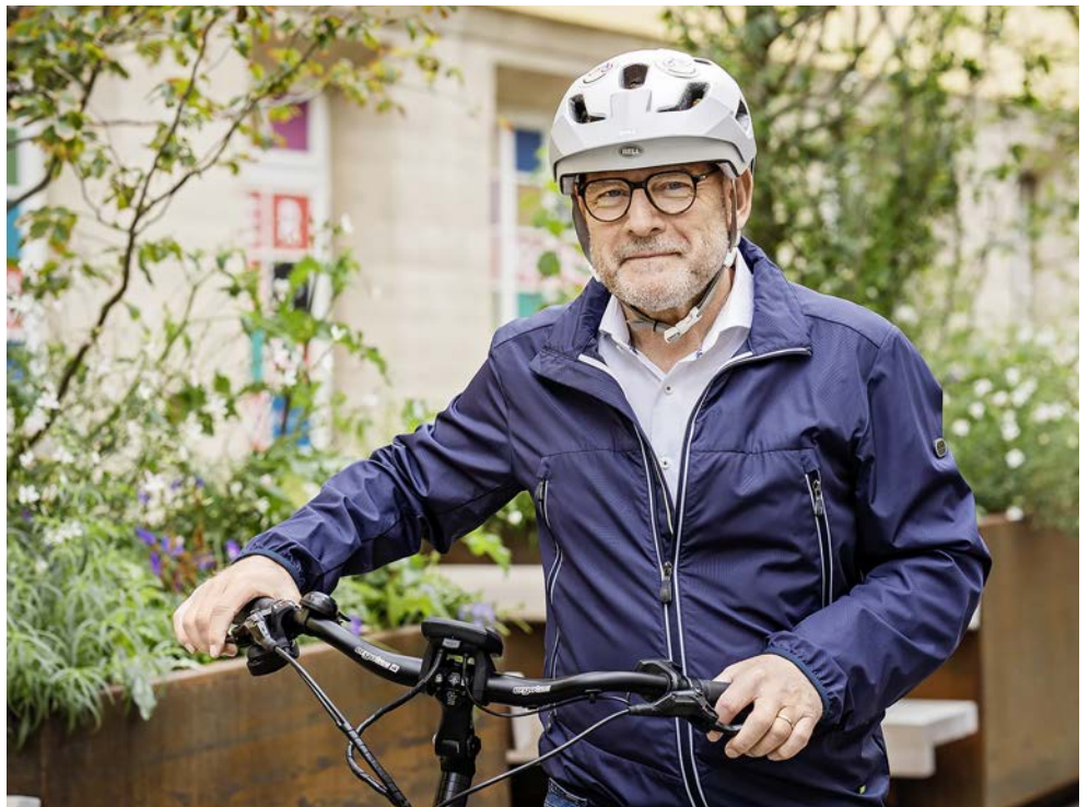
☒ Winfried Hermann (71) ist seit 1978 NaturFreund und seit 2011 Verkehrsminister in Baden-Württemberg. Der Gymnasiallehrer für die Fächer Deutsch, Politik und Sport zog 1984 erstmals für die Grünen in den Landtag in Stuttgart ein und war danach deren Landesvorsitzender. Von 1998 bis 2011 gehörte er dem Bundestag an und war unter anderem Vorsitzender des Verkehrsausschusses.