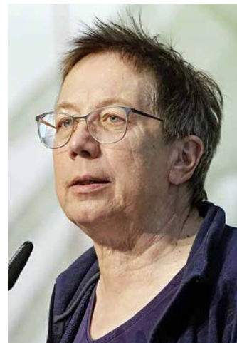
EIN STANDPUNKT VON REGINA SCHMIDT-KÜHNER STELLVERTRETENDE BUNDESVORSITZENDE DER NATURFREUNDE DEUTSCHLANDS