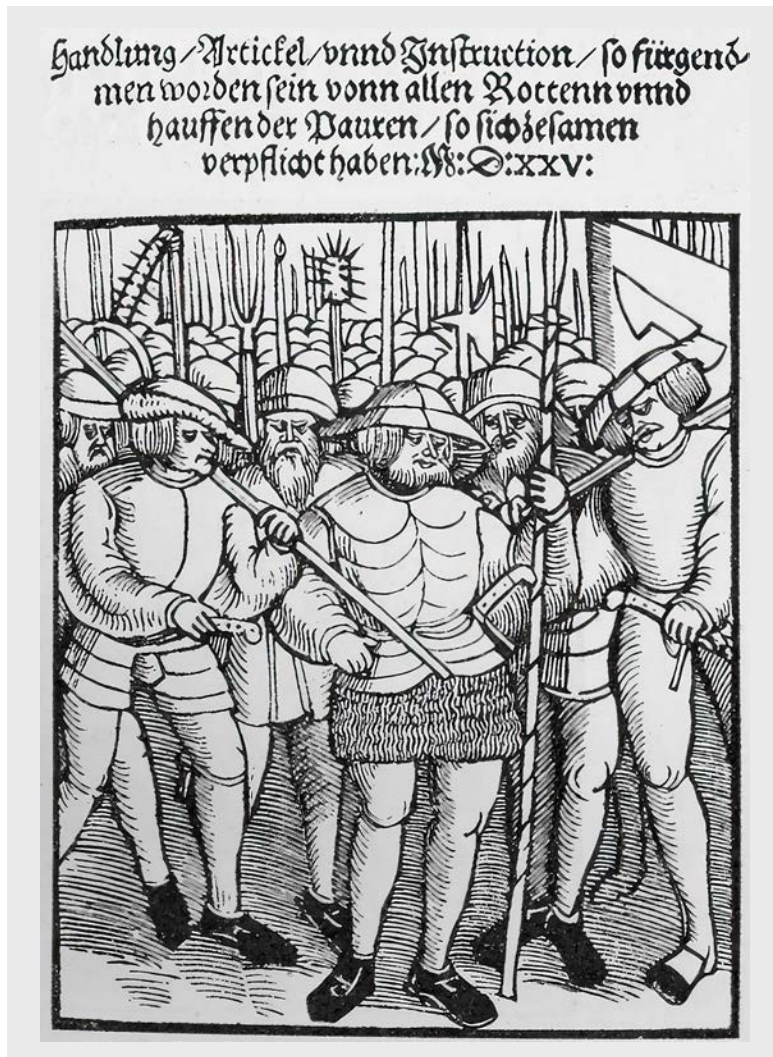
■ Für Menschen- und Freiheitsrechte: Titelblatt der „Zwölf Artikel“.

Unterdessen hatten die Fürsten, die zunächst von den Aufständen überrascht worden waren, ihre militärischen Anstrengungen verstärkt. Gegen Armeen aus gut ausgerüsteten Soldaten hatten die Bauern jedoch kaum eine Chance. Kanonen und Musketen gegen Mistgabeln und Dreschflügel – ein ungleicher Kampf. In mehreren Schlachten – in Balingen, Rottenburg, Herrenberg, Böblingen, Zabern (Saverne) – wurden die Bauernhaufen zwischen April und Juni 1525 geschlagen. Müntzer fiel dem Fürstenheer am 15. Mai bei der Schlacht von Frankenhausen/Thüringen in die Hände, wurde gefoltert und wie viele andere Bauernführer hingerichtet. Insgesamt kamen im Bauernkrieg wahrscheinlich 70-75.000 Menschen ums Leben. Was waren die Folgen? Die Niederlage ließ die Bauern als revolutionäre Subjekte für lange Zeit verschwinden. Zur „Bauernbefreiung“ und Aufhebung der Leibeigenschaft kam es erst Anfang des 19. Jahrhunderts – allerdings nicht als Ergebnis einer Revolution, sondern als „modernisierende“ Reform von oben. Und schließlich führten die Ereignisse von 1524-26 zu einer Stärkung der Landesfürsten, deren Heere siegreich gegen die Bauern gewesen waren. Die Zersplitterung der deutschen Territorien wurde weiter befestigt. ■