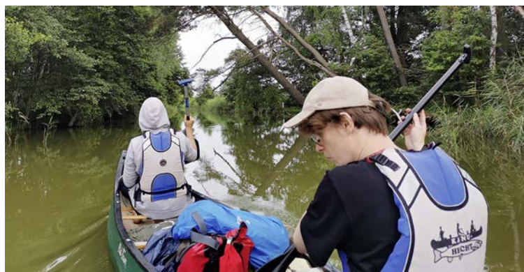
📄 Mit dem Kanu zur Gedenkstätte: politische Bildung in der Natur.