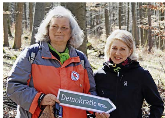
☒ Immer klar in Richtung Demokratie.