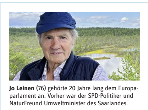
Jo Leinen (76) gehörte 20 Jahre lang dem Europaparlament an. Vorher war der SPD-Politiker und NaturFreund Umweltminister des Saarlandes.

Die Außenpolitik ist in den meisten europäischen Ländern eine Domäne der Regierung. Daher ist auch bei der EU die Kommission zuständig. Deutschland mit seiner Parlamentsarmee, bei der der Bundestag über Einsätze entscheidet, ist