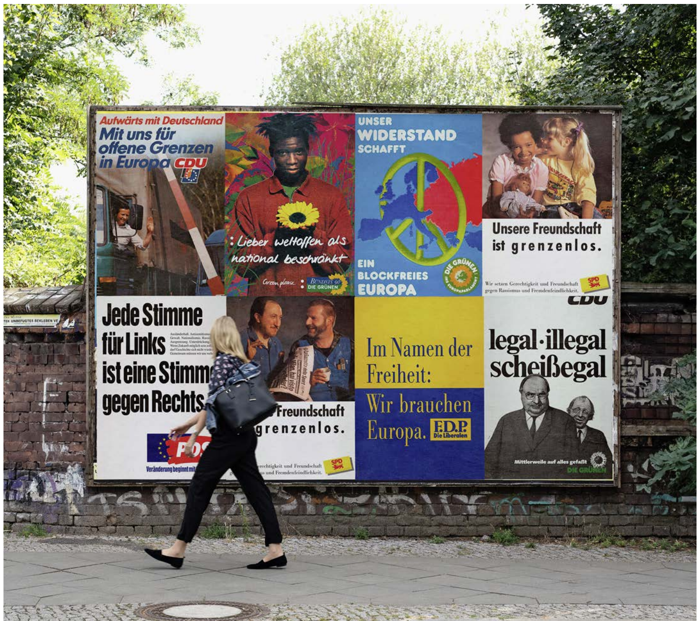
☒ Für Freiheit, Weltoffenheit und Freizügigkeit und keineswegs für Abschottung stand die EU in vielen Europawahlkämpfen. 1984 warb die CDU „für offene Grenzen“. Für die SPD war 1989 die Freundschaft „grenzenlos“ und die Grünen waren 1994 alles andere als „national beschränkt“.

mus. Gründe dafür waren oder sind Eurokrise, Bürokratie, Freizügigkeit und Flüchtlinge an Europas Außengrenzen. Das Vereinigte Königreich verließ die EU 2021 auch deshalb. Heute sind 27 Staaten in der EU, viele aus anderen Motiven als die Gründungsmitglieder. Nur mit Mühe können die Parteien der rechten und linken Mitte einen noch stärkeren Dammbreach nach rechts verhindern. Auch die Deutschen blicken kritischer auf Europa: 27 Prozent der Befragten sagen, Deutschland hätte von der EU überwiegend Nachteile, nur 26 Prozent sehen Vorteile, 41 Prozent sehen ein Gleichgewicht zwischen Vor- und Nachteilen.