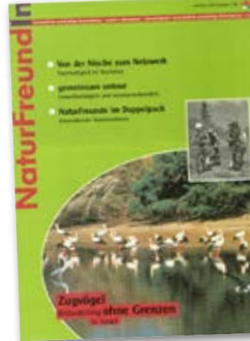
☒ Ab Ausgabe 3-2000 dann NaturFreundIn .