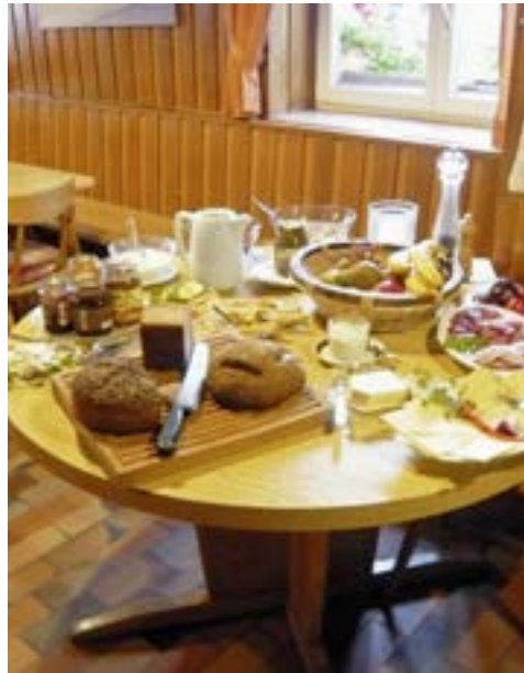
☒ Das Frühstücksbuffet, auch ein Arbeitsplatz.

Am Ende meines sechswöchigen Freiwilligenaufenthaltes ziehe ich ein Resümee. Viele private Vorhaben sind in der Arbeit untergegangen, auch die Neuausgabe von Peter Weiss' „Ästhetik des Widerstands“ geht ungelesen zurück. Dennoch hat der Feldbergaufenthalt bei mir etwas geändert: „Wer geht, sieht im Durchschnitt anthropologisch und kosmisch mehr, als wer fährt.“ Wer bei den NaturFreunden am Tag viel arbeitet und dann gut schläft, auch. Vieles hat sich in meinem Kopf bewegt: Ich werde hier ganz gut gebraucht. Ich werde Zuhause auf je-