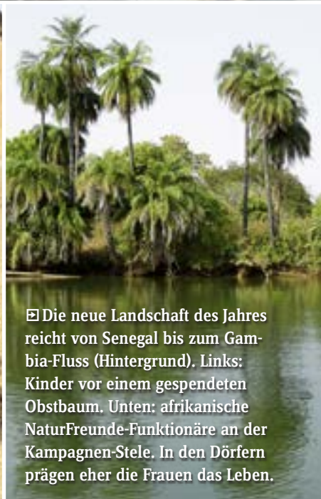
Die neue Landschaft des Jahres reicht von Senegal bis zum Gambia-Fluss (Hintergrund). Links: Kinder vor einem gespendeten Obstbaum. Unten: afrikanische NaturFreunde-Funktionäre an der Kampagnen-Stele. In den Dörfern prägen eher die Frauen das Leben.