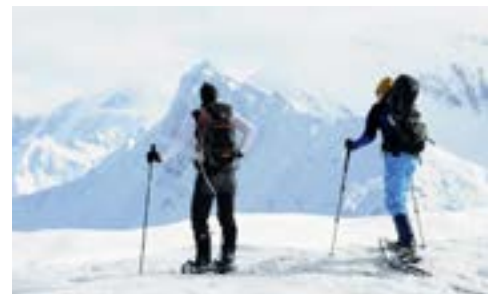
Wandertour im winterlichen Hochgebirge.

Eine solche Fortbildung besteht aus 13 Lehreinheiten, davon etwa zwei Drittel Praxis. Vermittelt werden die Technik des Schneeschuhgehens und Einblicke in Tourenplanung und Orientierung in der Winterlandschaft, zudem Material- und Ausrüstungskunde, erweiterte Erste Hilfe, alpine Wintergefahren und Umweltkunde. Wanderleiter können danach in weglosem schneebedecktem Gelände Touren anbieten. Mit