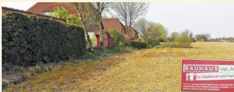
☒ Glyphosat vergiftet Felder und Gärten. BAUHAUS stoppte den Verkauf.

Reicht angesichts dieser Risiken für Natur und Umwelt noch eine Aufklärungskampagne?