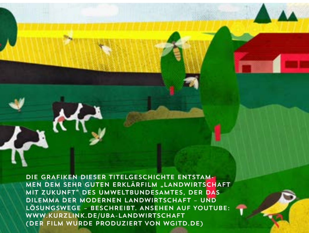
DIE GRAFIKEN DIESER TITELGESCHICHTE ENTSTAMMEN DEM SEHR GUTEN ERKLÄRFILM „LANDWIRTSCHAFT MIT ZUKUNFT“ DES UMWELTBUNDESAMTES, DER DAS DILEMMA DER MODERNEN LANDWIRTSCHAFT – UND LÖSUNGSWEGE – BESCHREIBT. ANSEHEN AUF YOUTUBE: WWW.KURZLINK.DE/UBA-LANDWIRTSCHAFT (DER FILM WURDE PRODUZIERT VON WGITD.DE)

Deshalb forderten im Januar mehr als 30.000 Demonstranten auf der „Wir haben es satt“-Demonstration in Berlin einen Umbau hin zu einer „umwelt-, tier- und klimafreundlichen Landwirtschaft, in der Bauern gut von ihrer Arbeit leben können.“ ■