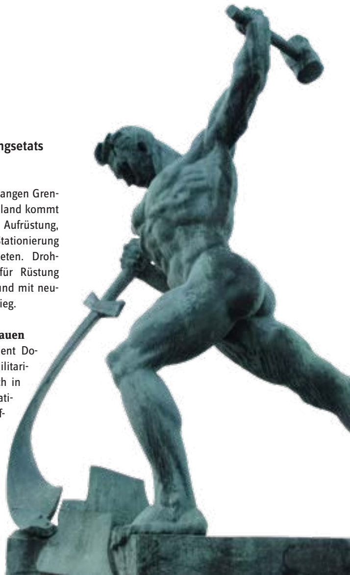
☒ Steht vor UNO-Gebäude: Plastik Schwerter zu Pflugscharen.

Wir fordern ein klares Nein zu solchen Plänen. Die Milliardenkosten für die Aufrüstung würden der Modernisierung der Infrastruktur, dem sozialen Wohnungsbau, der Entwicklungszusammenarbeit oder im Kampf gegen den Klimawandel fehlen. Ja, wir leben in einem unfertigen Frieden, in dem die ökologischen Risiken ebenso zunehmen wie soziale Ungleichheiten. Auch Hunger, Elend und die Erderwärmung erzeugen Gewalt, die unseren Planeten erschüttern und Kriege auslösen können. Statt aber ins Militär muss Geld in die 17 Nachhaltigkeitsziele der Agenda 2030 und das Pariser Klimaabkommen fließen, um die Erderwärmung möglichst bei 1,5 Grad Celsius zu begrenzen. Das sind Investitionen, die für den Frieden unverzichtbar sind.