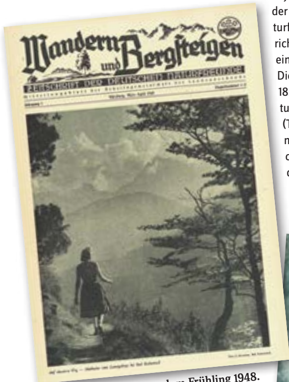
☒ Die Erstausgabe aus dem Frühling 1948.

Im März 1949 erschien dann unter dem Titel Wandern und Bergsteigen erstmals die „Zeitschrift der Deutschen Naturfreunde“.