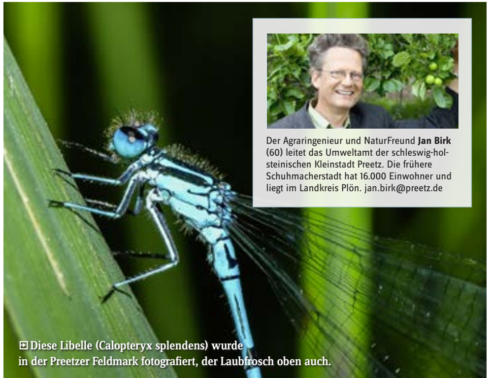
☒ Diese Libelle ( Calopteryx splendens ) wurde in der Preetzer Feldmark fotografiert, der Laubfrosch oben auch.