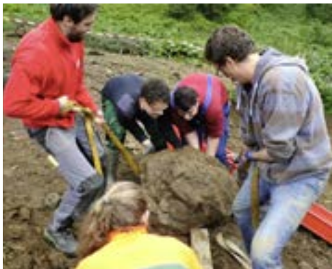
☒ Die Arbeit kann durchaus sehr schwer sein.

An einigen Tagen kann ich noch eine weitere „Arbeiterin“ im Naturfreundehaus bewundern, so alt und unglaublich fit und mit einer wunderbaren Sprache: genau-langsam-deutlich. Von ihr lerne ich, wie die Matratzenschonbezüge mit einer besonderen Staubsaugerbürste abzusaugen sind, wie richtig geputzt wird und mehr: Immer noch reist sie in das senegalesische Naturfreundehaus und hält uns abends einen Lichtbildervortrag über die Reise. Bücher hat sie auch da-