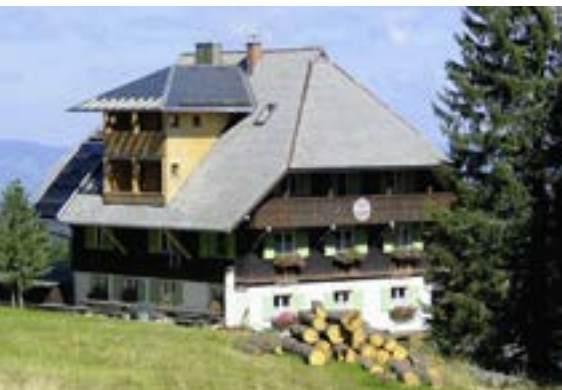
Das Naturfreundehaus Feldberg (L 40).

Zu Beginn des letzten Jahres war die Absicht gereift: Jetzt, als Pensionär und 68 Jahre alt, bewirbst du dich als Helfer für sechs Wochen beim Naturfreundehaus Feldberg (L 40). Den Schwarzwald habe ich schon oft durchwandert und kenne auch das Naturfreundehaus, die Na-