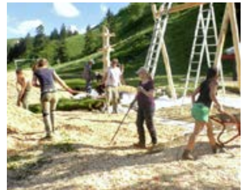
Viele Freiwillige arbeiten im und am Haus.

Über die Gäste könnte ich Romane schreiben. Wer hier alles reinkommt. Der Drachenbauexperte, der Pilzexperte, die Schmetterlingsexpertin, Nordic-Walking-Experten, dazu Bergwächter, Natur- und Erlebnispädagogen und Schüler und viele, viele mehr. In der Speisekarte steht: „Unser Naturfreundehaus Feldberg ist ein lebendiger Ort der offenen Begegnung. Alle Gäste mit demokratischer und toleranter Grundhaltung sind herzlich willkommen.“ Das ist schön, anscheinend aber auch ohne abschreckende Wirkung. Deshalb kommt es schon mal zu kräftigen Diskussionen.