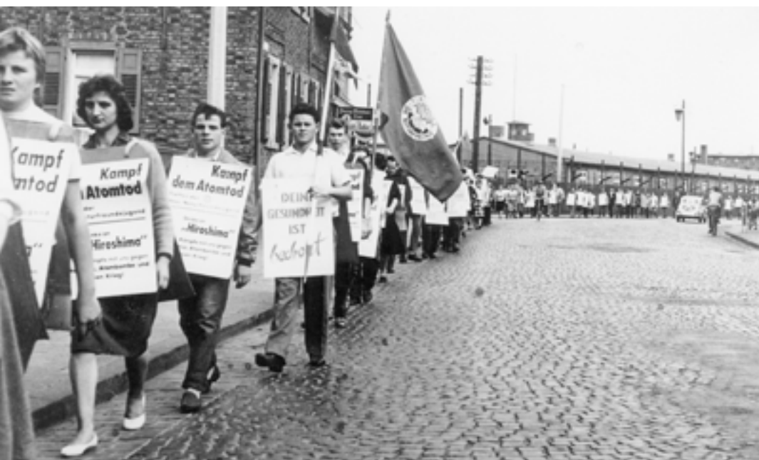
☒ 1959: „Kampf dem Atomtod“-Demonstration der hessischen Naturfreundejugend nach Offenbach.

Die gesellschaftliche Bedeutung der Ostermärsche der 1960er-Jahre sollte nicht wieder erreicht werden. Drängender und unmittelbarer sind längst andere Fragen, etwa die ökologische Endlichkeit der Welt, die soziale Ungerechtigkeit und neue Gefahren von rechts. Das macht