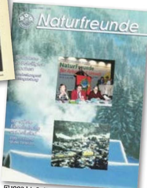
☒ 1992 hieß die Zeitschrift Naturfreunde .