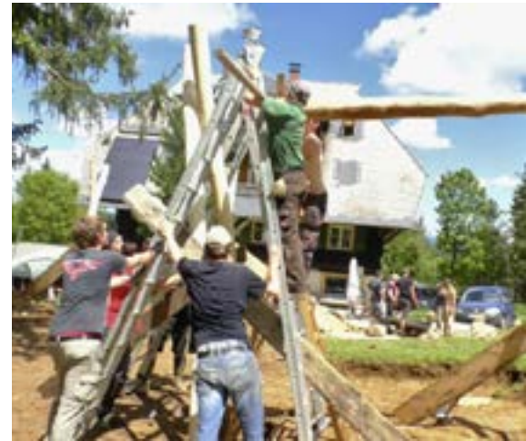
☒ Ohne Freiwillige bliebe Vieles liegen.

Soll ich im nächsten Sommer wiederkommen? Meiner Tochter sage ich: „Wahrscheinlich ja, wenn die wollen. Aber dann mit viel weniger Büchern und Aufsätzen. Und mit einem richtigen Blaumann.“ ■ BRUNO M. BUCHHOLZ